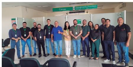
Banco da Amazônia - Araguaçu

to Mais Próximo dos Bancários, foram entregues brindes e materiais informativos. Mais do que isso, foi um momento de escuta, diálogo e conexão, reafirmando a presença do Sindicato em todas as regiões do Tocantins.