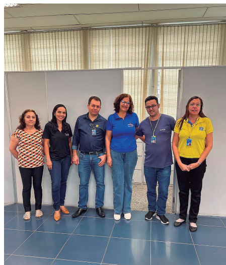
Banco do Brasil - Arraias