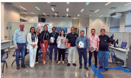
Caixa Econômica - Augustinópolis