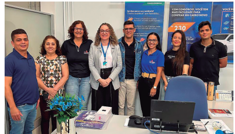
Caixa Econômica - Dianópolis