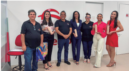
Bradesco - Colinas