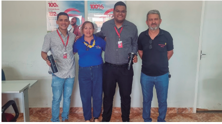
Bradesco - Miranorte