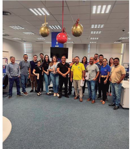
Banco do Brasil - Escritório de Negócios - Palmas