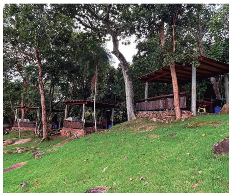
Pergolados em Palmas