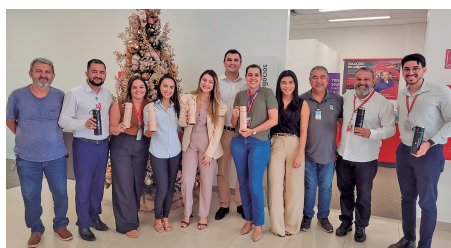
Bradesco - Av. JK Palmas