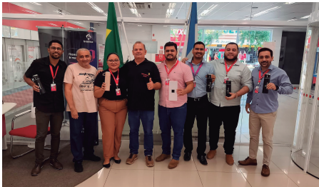
Caixa Econômica - Agência Javaé