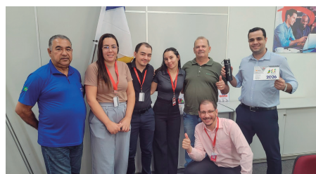
Bradesco - Formoso do Araguaia