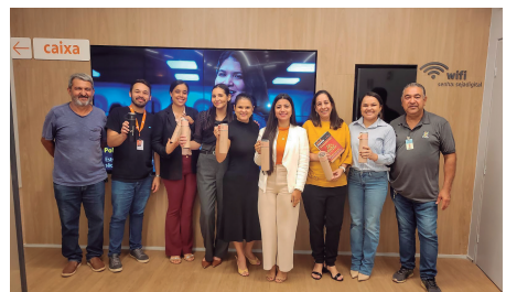
Itaú Unibanco - JK Palmas