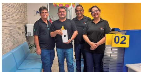
Banco do Brasil - Nova Olinda